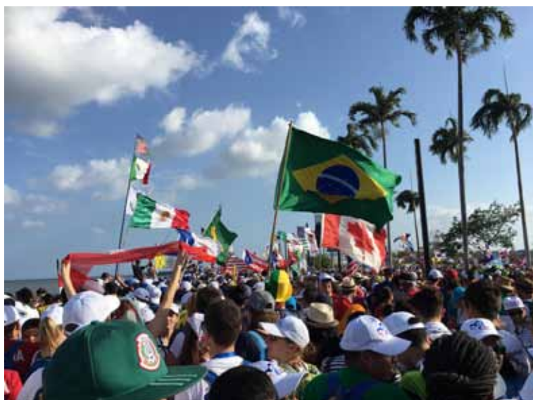
Viele Fahnen beim Weltjugendtag.