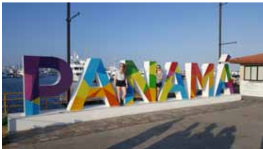
Vor dem Schriftzug „Panama“.

Den nächsten Tag verbrachten wir mit einer Bootsfahrt am Gatunsee, Teil des Panamakanals. Hierbei beobachteten wir Tiere wie Vögel, Brüllaffen, Schmetterlinge, Geckos und Faultiere und naschten von exotischen Früchten wie Bananen, Mangos, Ananas, Melonen, Papayas und Kakao-früchten.