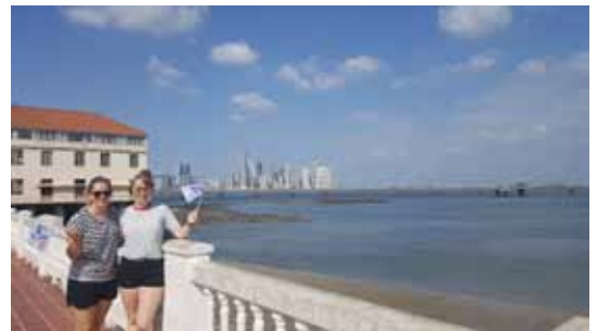
Die Sky- line von Panama City.