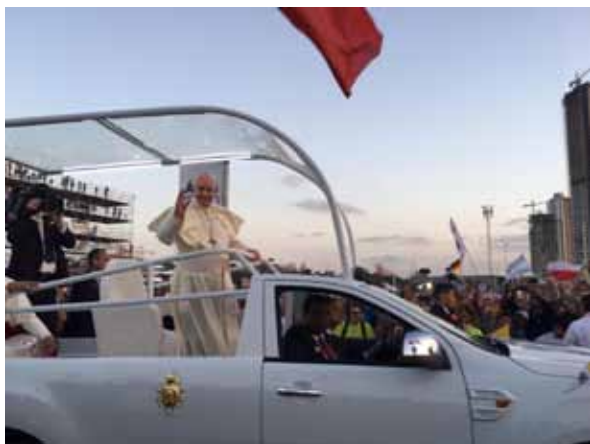
So nahe waren wir dem Papst.

„Denn, junge liebe Freunde und Freundinnen, ihr seid nicht die Zukunft, sondern das Jetzt Gottes.“