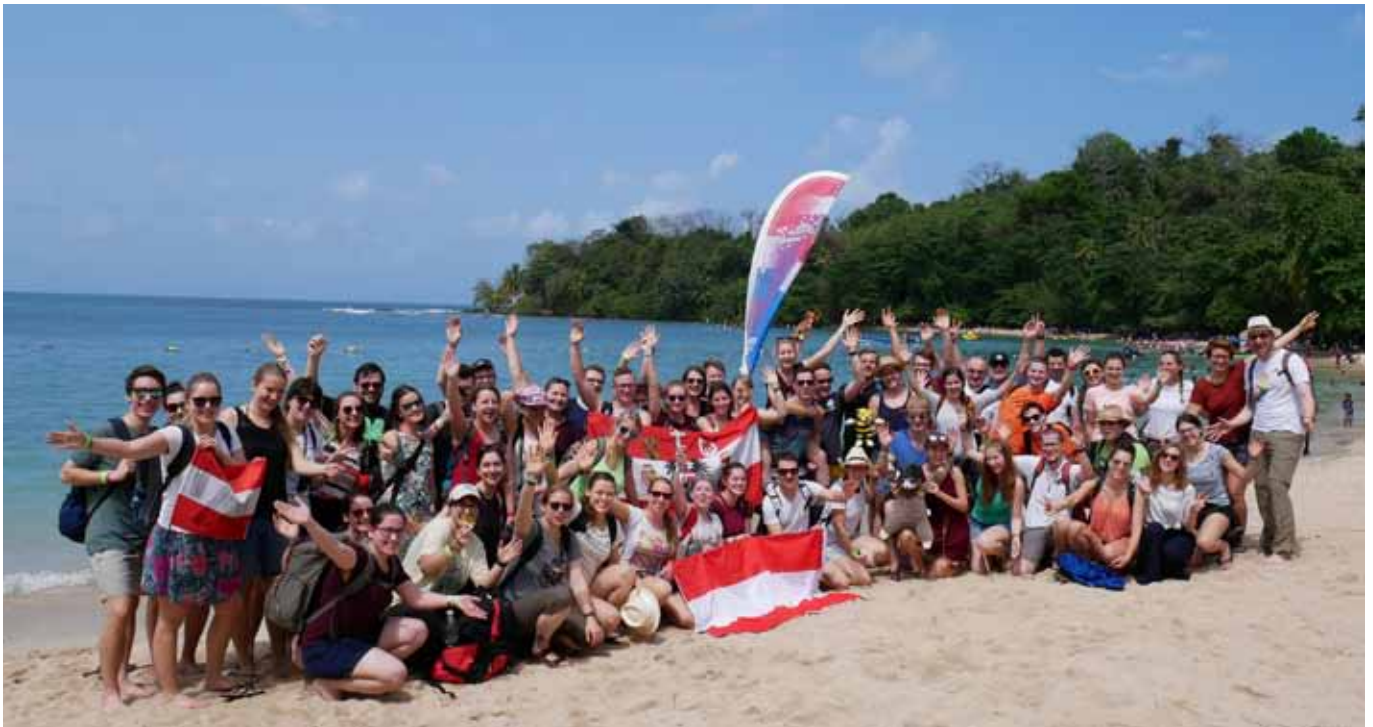
Gruppenfoto der steirischen Reisegruppe auf der Isla Grande.