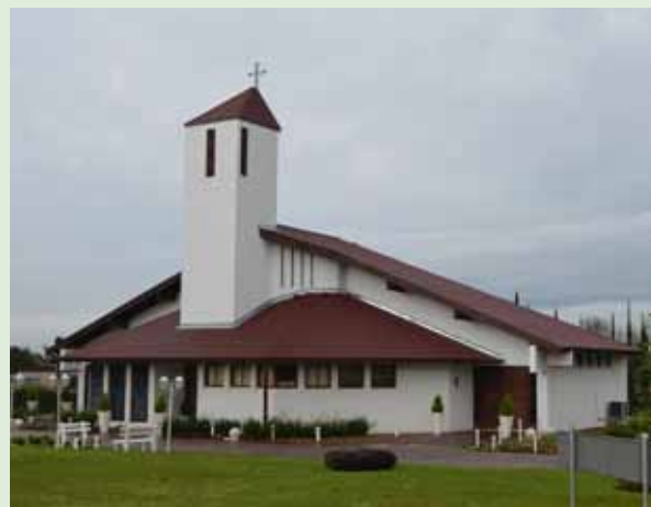
Avenida Michael Moor, 1951. +55 42 3625 8328.